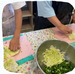
土曜日はみんなで クッキング