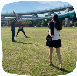
みんなで歩いて 公園へ