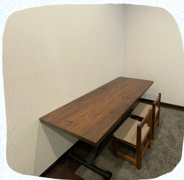
集中して取り組める 学習スペース