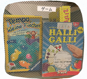
ゲーム・おもちゃも 充実しています