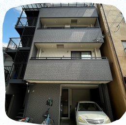
外から見たくじらぐも