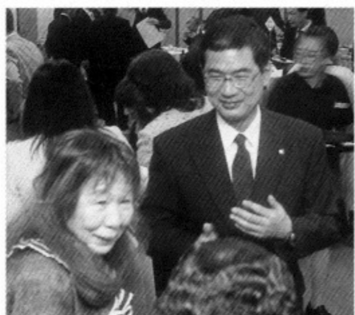
いつも、お世話になっております。