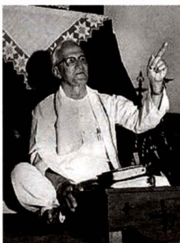
宣教師でアシユラム運動を紹介したスタンレー・ジョーンズ

に宛てて、日本の近衛首 相が交渉のための会議の 準備を望んでいると打電 した。 ジョーンズは攻撃1週 間前から昼夜無休の祈禱 会を始めていた。日本や オーストラリア、中国の 友人たちに電報で祈りを 要請した。賀川は次のよ うに返事を送った。 「日本の教会指導者は たが奇跡的に助けられ た。死んだようになって いた私を従卒が助けてく れた。周りの兵隊はもう 後宮牧師は真珠湾攻撃 の翌年、ソロモン海戦で 負傷する。海に放り出さ れたが奇跡的に助けられ た。死んだようになって いた私を従卒が助けてく れた。周りの兵隊はもう 後宮牧師と賀川との関 わりは、賀川の推進して