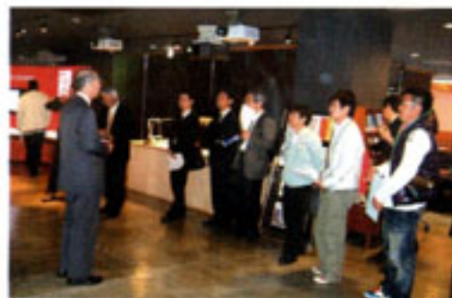
「賀川記念館」での見学の模様