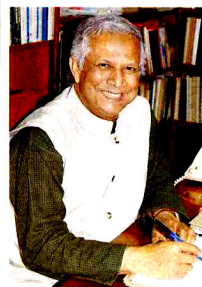
Muhammad Yunus 経済学者。グラミン銀行総裁。40年、英国インド北東部のチッタゴン（現在のパンガラデシュの第2の都市）生まれ。80年代に奨学金を得て米国に留学。70年に米バンダービルト大で経済学博士号を取得後に帰国し、チタゴン大経済学部長に。76年に貸し出し、人々の自立を促す手法として、マイクロクレジットを考案。83年にグラミン（農村）銀行を設立して、活動を全国に広げた。08年にノーベル平和賞受賞。新著に「貧しい世界を創る」（日本語訳、早川書房）。68歳。

「誰かの金持ちが起した危機で、生活が困窮し職を失った世に30億人いる。庶民の一人々々、今日も職を失って返済しつづける。企業も大失態を繰り返している。金融市場はカジのまじり、実体の火傷を伴っている。」