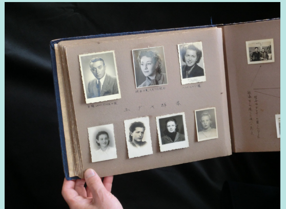
杉原ビザで生き残られた7人のサバイバーたち

1944年三重県上野市(現・伊賀市)生まれ。66年度慶応義塾大学文学部仏文科卒、国際観光振興会(現・国際観光振興機構=JNTO)に就職。ジュネーブ、ダラス、ソウルの各在外事務所に勤務。98年国際観光振興機構コンベンション誘致部長。2004年JNTO退職。著書に『風雪の歌人』(講談社出版サービスセンター)、『争いのなき国となれ』(英治出版)、「韓国の観光カリスマ」(交通新聞社)、『釜山港物語』(社会評論社)があります。